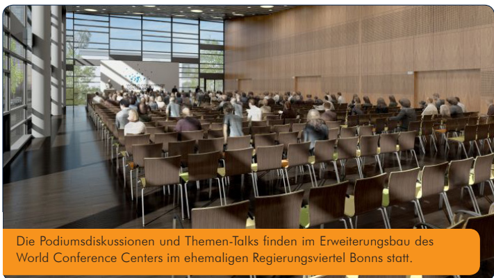
Die Podiumsdiskussionen und Themen-Talks finden im Erweiterungsbau des World Conference Centers im ehemaligen Regierungsviertel Bonn statt.

Wer schon genauere Vorstellungen über die eigene berufliche Zukunft hat oder bei einem Jobwechsel konkret weiß, wer der neue Wunsch-Arbeitgeber sein soll, kann sich im Vorfeld der women&work online bis zum 30. Mai für vortermionierte Vier-Augen-Gespräche anmelden.